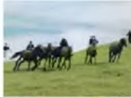
エコツーリズムメニュー